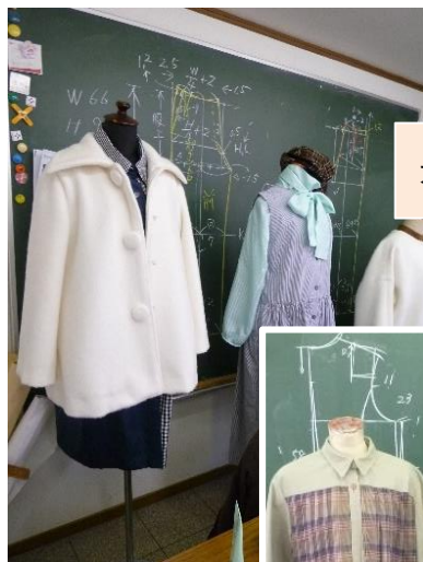
オリジナル作品例