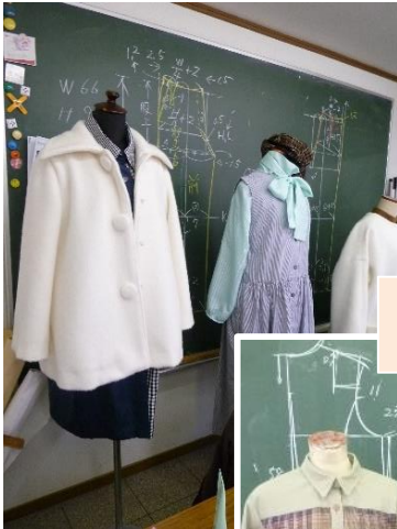
オリジナル作品例